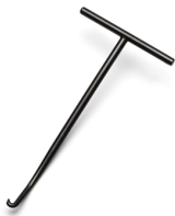
Yamaha Spring Hook Puller