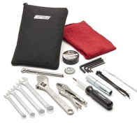
Metric Tool Kit